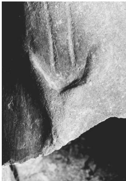
Siluetta d'un cap de brau a la base del mànec d'un pot

A la sala dedicada a la cultura talaiòtica del Museu de Menorca hi ha diferents representacions de la figura del brau. Possiblement la més antiga que tenim sigui la silueta d'un cap, a la base del mànec d'un pot troncocònic trobat al talaiot de Trebalúger.