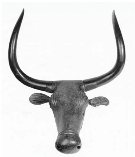
Cap de bou de Costitx

Un d'aquests animals deïficats i portats de molt antic a la categoria del símbol ha estat el brau o el bou. El brau, al llarg de la història i arreu de les cultures del món,