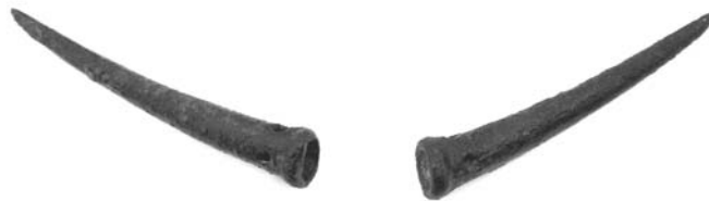
Parell de banyes de Calascoves

A la cova 7 de Calascoves s'hi van trobar un parell de banyes que, possiblement, van formar part d'un taüt de fusta en forma de brau.