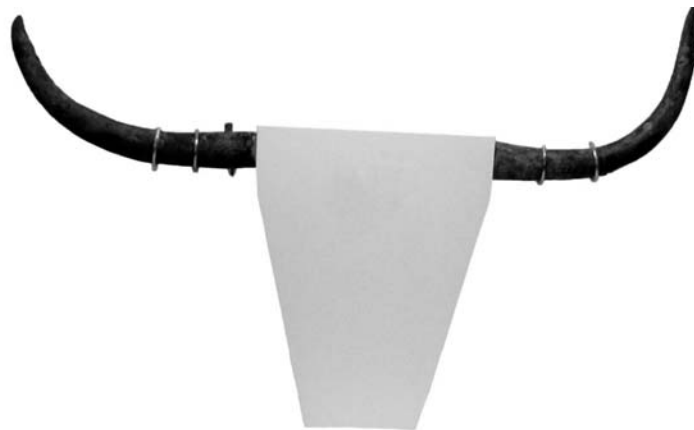
Dues de les banyes de la cova des Coloms muntades sobre la silueta d'un cap de bou

Unes altres representacions que en tenim són les quatre banyes, trobades a la Cova des Coloms, al barranc de sant Agustí des Migjorn Gran; dues d'aquestes banyes podrien formar una parella i a l'exposició del Museu estan muntades sobre la silueta d'un cap de brau.