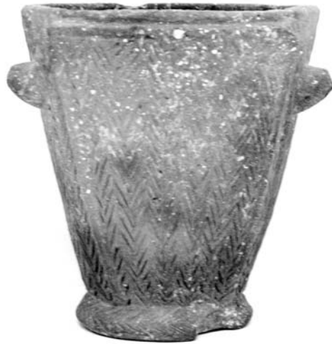
Vas de fons alt

També s'ha interpretat com a l'esquematització de la silueta d'un brau o bou el vas dit de doble fons o fons alt, un pebeter o cremador d'herbes aromàtiques dels darrers segles de la cultura talaiòtica.